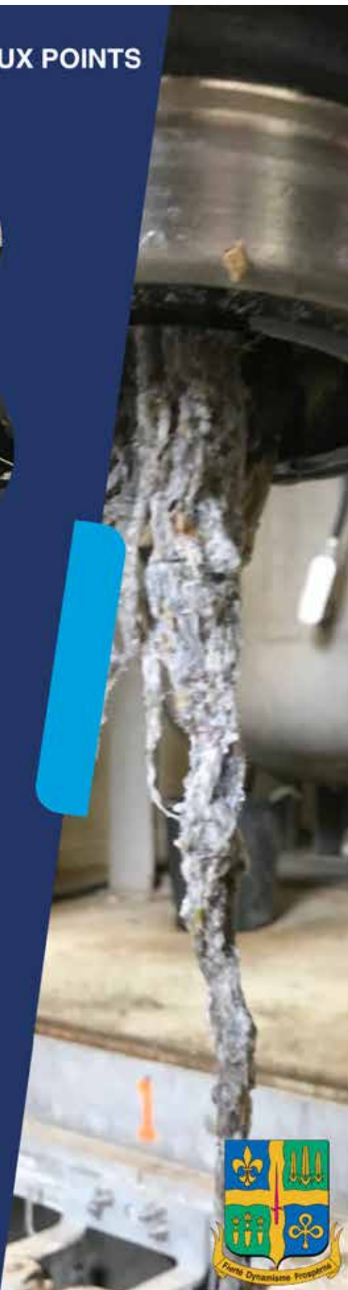
Photo pompe Saint-David

ENCORE UNE FOIS, NOUS DEMANDONS VOTRE AIDE AFIN DE LES CONSCIENTISER LE PLUS POSSIBLE AUX CONSÉQUENCES DE JETER LEURS JOUETS DANS LES TOILETTES.