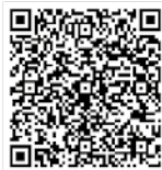
Carte interactive Frigos

De plus, les Incroyables Comestibles sont allés à la rencontre de plus de 300 enfants et 40 moniteurs de 8 terrains de jeux de la MRC afin d'animer des ateliers culinaires. Mais, bien au-delà de la simple recette, accompagné par l'outil de Tremplin Santé, nous avons abordé les thèmes tels que: « La saine alimentation, Les mesures d'hygiène et salubrité en cuisine, les techniques de coupe et découpe des légumes, le gaspillage alimentaire, les standards de beauté des fruits et des légumes, la production de fruits et de légumes locaux, la nourriture et la science, sans oublier la fameuse dégustation de germinations. Les enfants ont participé avec enthousiasme à la réalisation de recettes simples qu'ils peuvent refaire à la maison. De beaux projets à venir pour l'an prochain!